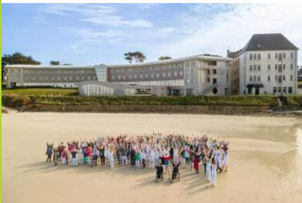
Les 100 ans de Trestel en 2022.