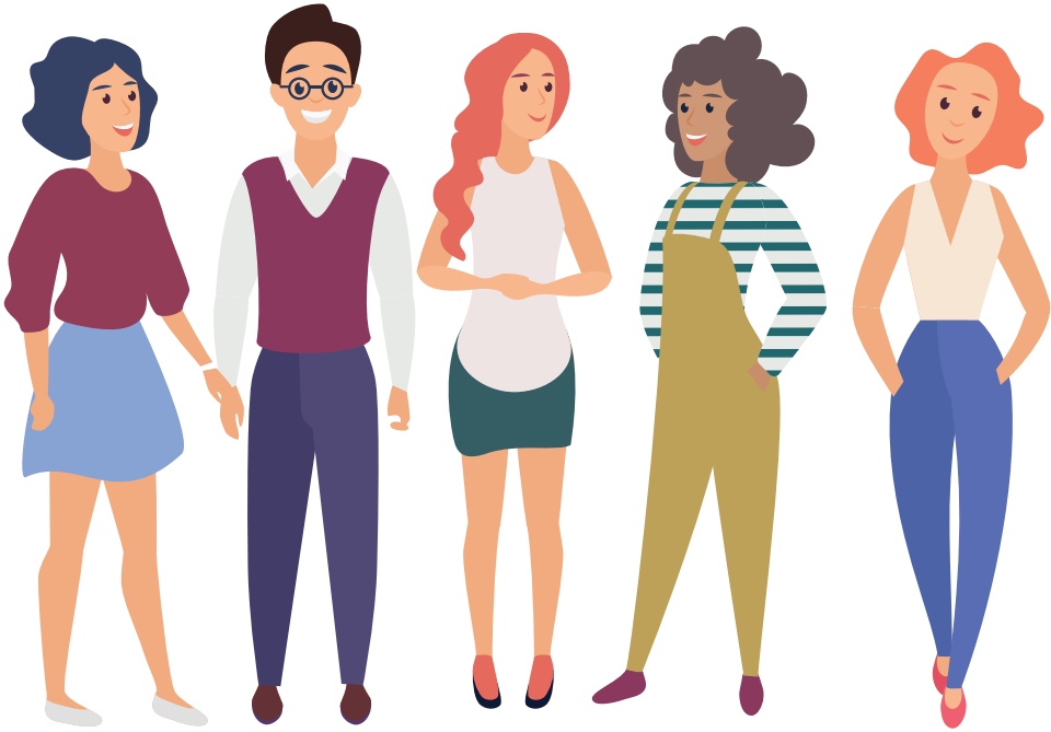
Personnes en couple