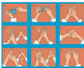
Friction avec une solution hydro-alcoolique