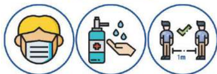
Lavage simple des mains

Le respect des gestes barrières est l'affaire de tous !