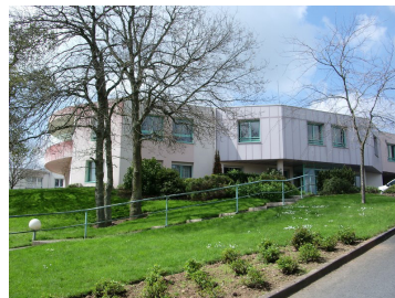
La Petite Montagne avec 60 places. Elle est située à moins d'1 kilomètre du site hospitalier