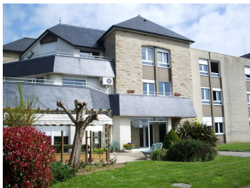
Les Hortensias avec 90 places