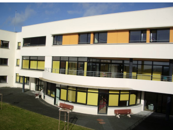
Ti Nevez avec 126 places